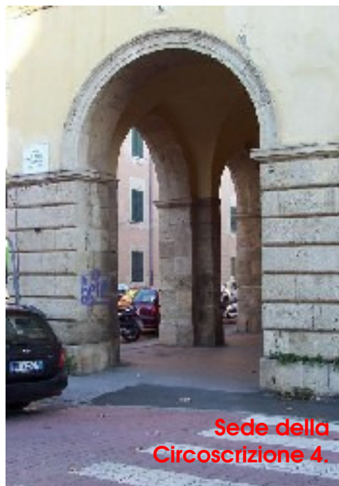
Sede della Circoscrizione 4.

Martedì 2 Dicembre 2008 ore 15,45 - ore 19,30 Centro Civico della Circoscrizione 4 Via Menasci 4 - LIVORNO